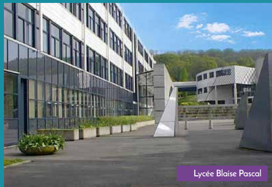
Lycée Blaise Pascal

La résidence Cœur d'Orsay est idéalement placée à proximité immédiate du centre-ville avec ses supérettes, ses restaurants et son cinéma Jacques Tati. Les enfants peuvent aller à l'école de la maternelle au lycée sans changer de quartier. Toute proche, la piste cyclable des Genêts mène aux bois de la Cyprenne ou aux bords de l'Yvette.