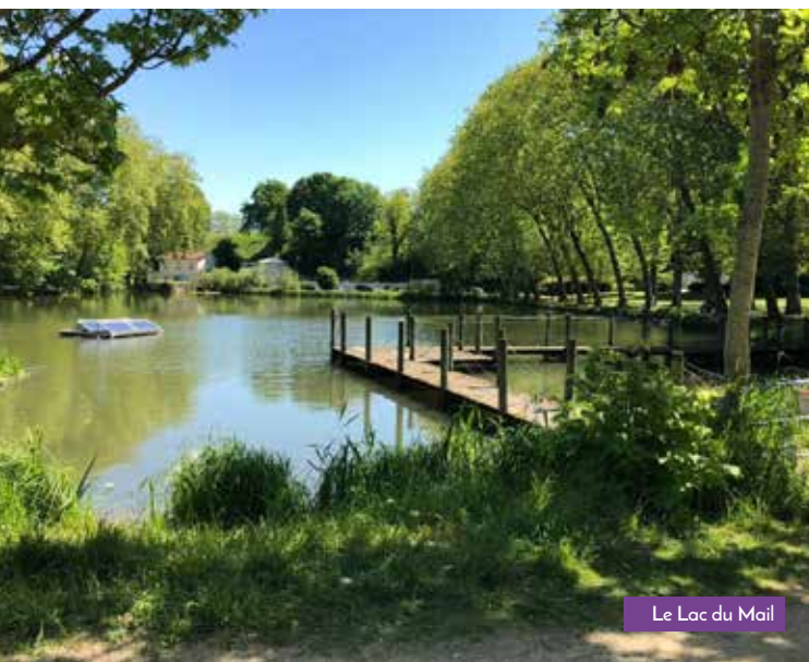
Le Lac du Mail