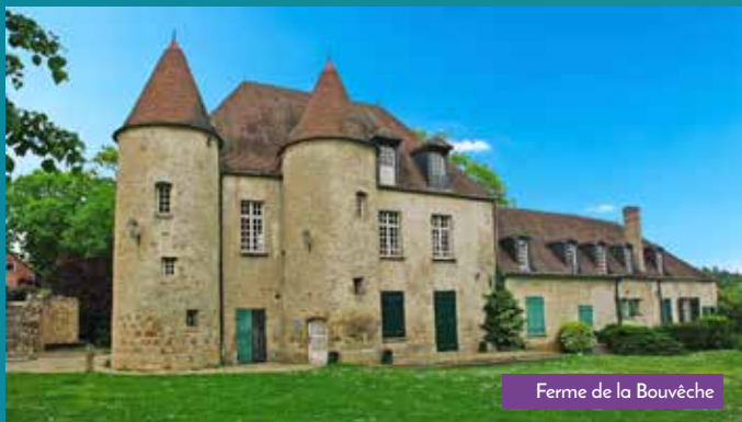
Ferme de la Bouvêche