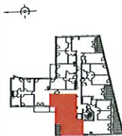
PLAN DE REPERAGE

NOTA: - Des modifications sont susceptibles d'être apportées à ce plan en fonction des nécessités techniques, de la réalisation (tnt) en ce qui concerne les dimensions libres que l'équipement. - Les surfaces et les cotes indiquées (dimensionnelles ou atmosphériques) sont soumises aux tolérances réglementaires. - Les soffits, poutres, faux-plafonds, gaines sont susceptibles d'évoluer en situation, nombre, dimension. - Les planchers et les sols sont indicatifs et peuvent faire l'objet de modification, aussi bien en nombre qu'en type. - Les serrures, rebords, regards ne sont pas figurés. - La surface habitable est approximative. - Le mobilier et l'électroménager ne sont pas fournis. - Le mobilier est représenté dans la chambre et à titre indicatif de la norme handicapé. La literie est non fournie. - Les surfaces des placards sont incluses dans les surfaces des pièces abritantes. - Les parois indiquées sur les plans ont une hauteur de 1.00m.